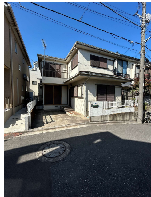
販売現地(令和7年2月撮影)